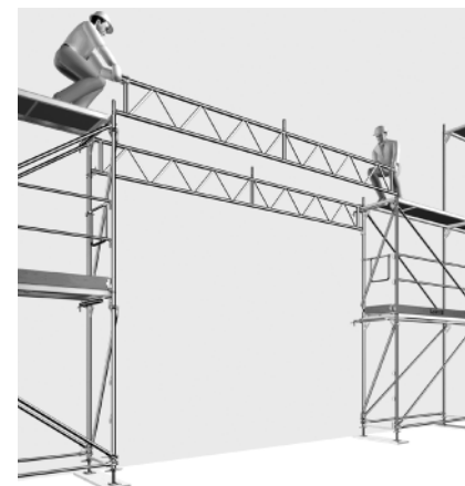
Rys. 4. Dźwigar Blitz

tów, zachowując jednocześnie ich właściwości statyczne. W zależności od obciążenia, przeznaczenia, zdolności przewozowych i magazynowych każde rusztowanie można zestawiać. Ramowy system Blitz z ocynkowanej ognioowo stali dostępny jest w szerokości 0,73, 1,09 m lub szerokości 0,73 m w przypadku, gdy jest wykonany z aluminium. System ma pomosty robocze i elementy osprzętu pasujące do obu szerokości rusztowania. Długości pola roboczego to 0,73, 1,09, 1,57, 2,07, 2,57, 3,07 i 4,14 m. Wysokość rusztowania może wynosić do 80 m (bez obliczeń statycznych).